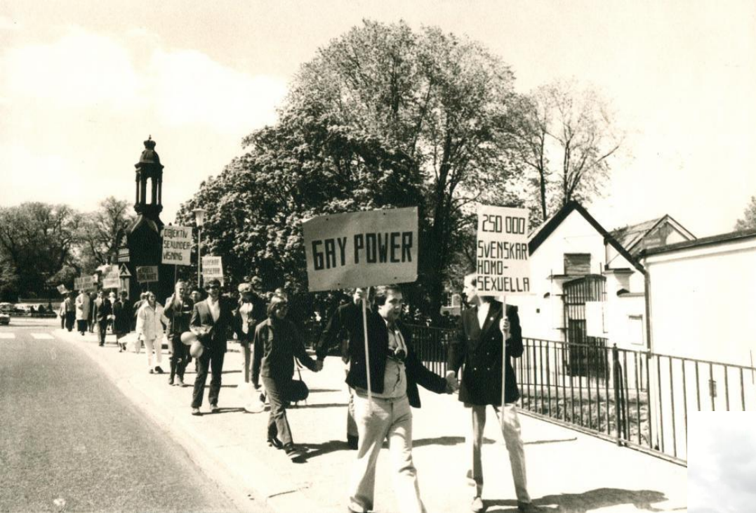
The first "gay pride" march in Uppsala, the second in Sweden, May 1971